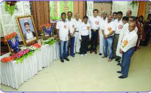
સ્નેહમિલન પ્રસંગે મહેમાનો અને મંડળની ટીમ