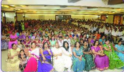
સ્નેહમિલનમાં ઉપસ્થિત જ્ઞાતિજનો અને મહેમાનો