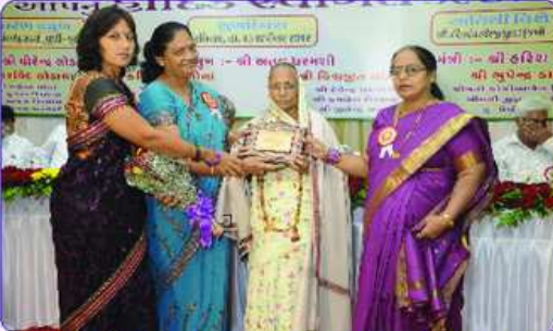
મહાકાલી ભાવનાના ઘતા પરિવારનું બહુમાન