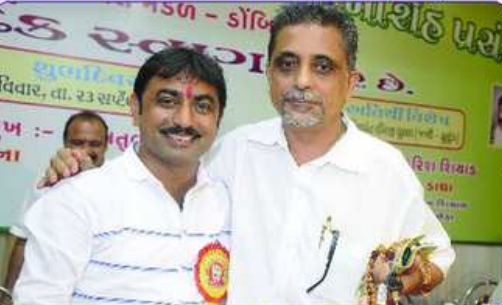
સમસ્ત મહાજનના સેક્રેટરી જનરલ સાથે પ્રમુખશ્રી