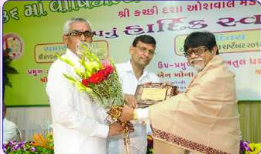
મહાકાલી ભાવનાના ઘતા પરિવારનું બહુમાન