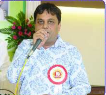
હારચેપારાના લાભાર્થી AYSના પ્રતિનિધી