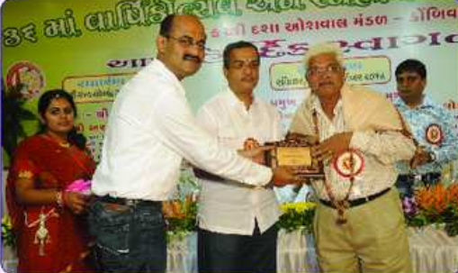
મહાકાલી ભાવનાના ઘતા પરિવારનું બહુમાન