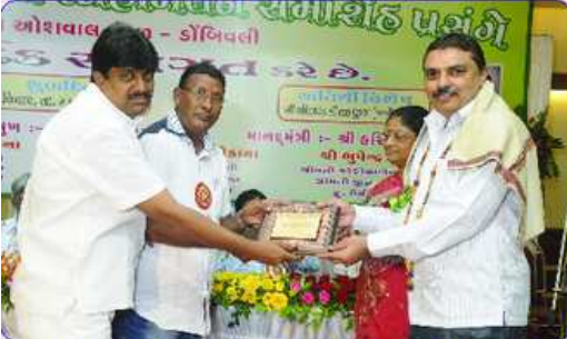
મહાકાલી ભાવનાના ઘતા પરિવારનું બહુમાન