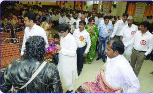
અનંતયુવા શક્તિ ટીમ દ્વારા હારચેપારા