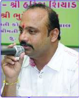
માનવંતા મહેમાનોનું શાનદાર સ્વાગત