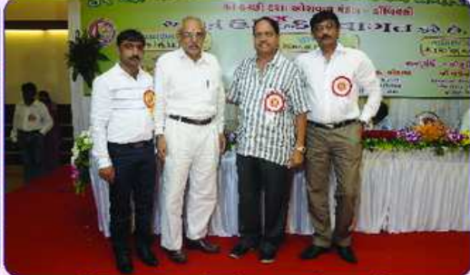
તપસ્વી બહુમાનના ઘતા પીર પરિવારનું બહુમાન