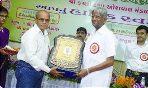
વાર્ષિક સ્નેહમિલનમાં ઉપસ્થિત જ્ઞાતિજનો