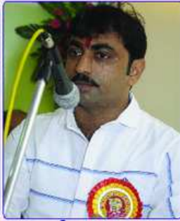
પ્રમુખશ્રી દ્વારા આવકાર માનદમંત્રી દ્વારા અહેવાલ